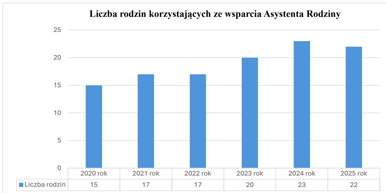
Tabela 2: Informacje dotyczące rodzin korzystających ze wsparcia Asystenta Rodziny w 2025 roku